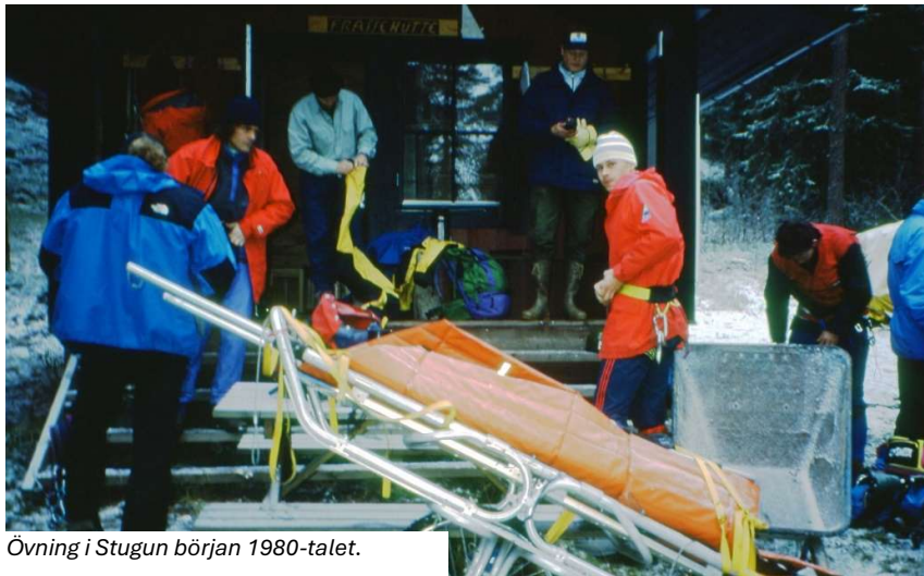
Övning i Stugun början 1980-talet.

Under senare år har de skarpa räddningsuppdragen blivit fler och fler.