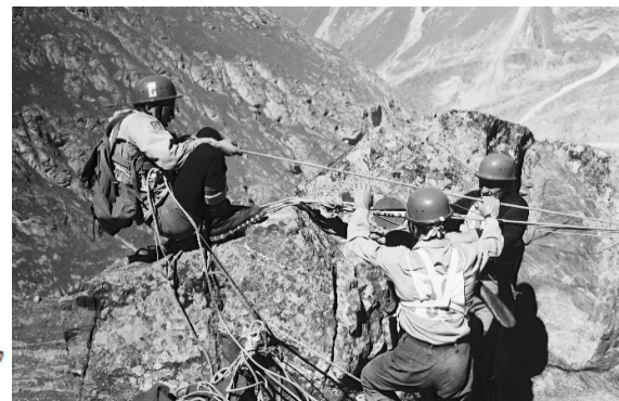
Figur 3 Sovjetisk alpin grupp tävlar i momentet Kanvratljälp 1973.