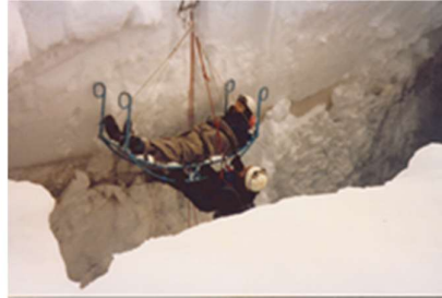
Figur 2 Räddning ur glaciärspricka.

Utrustningen moderniserades och kompletterades, gruppens sammansättning sågs över och deltagarnas föregenskaper och förmågor poängsattes. Nya bårar och vinschar med mera anskaffades All lätt klätter-utrustning ersattes med rustikare material som exempelvis stålkabiner med skruvlåsning och enbart statiska rep i stället för vajer. Försök med olika radiosystem prövades men ett fungerande radiosamband uteblev. Rutiner för besiktning av utrustningen började tillämpas.