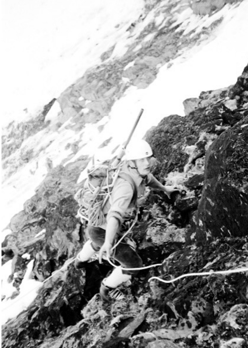
Vägerspelet bärs till en klippshylla under SO väggen Tuolpagorni.

Förplanering hade då skett i en mindre grupp och utrustning var anskaffad via Rikspolisstyrelsen. Modellen var kopierad från alpländerna och den gemensamma utrustningen bestod av rep och förankringsutrustning, wiespel med 1000m stållina, bårsele för skadad person och bår. Båren var försedd med ett stödhjul för att underlätta långa transporter på planmark. All personlig utrustning som hjälm, klättersela, stegjärn rygsäck förutsattes medlemmarna själva tillhandahålla. Radiokommunikation inom gruppen och till räddningsledningen saknades helt.