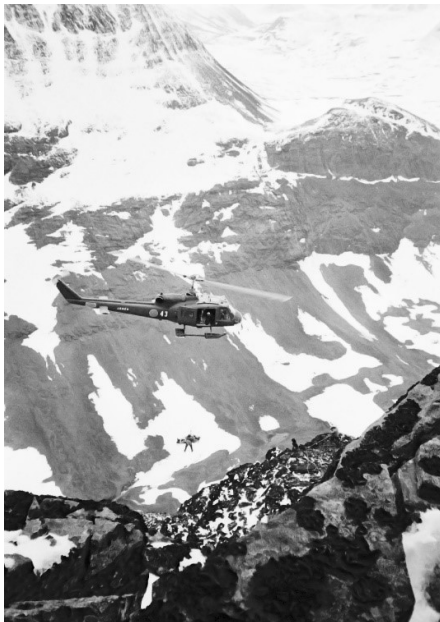
Räddningsövning på Nallo 1975.

Elddopet kom 1972 när två värnpliktiga från Arméns Jägarskola saknades. Efter en stor sökinsats i Tarfala kunde dom efter fyra dygn lokaliseras och räddas från en klippavsats på Kebnepaktes östkam ovanför "Svarta väggen" där de klättrat fast i det dåliga vädret. För att nå klipphyllan krävdes av räddningsmännen en utsatt klättring på nedisad klippa i två replängder vilket troligen räddade de värnpliktigas liv. Helikopter kunde dock användas för transporten till Tarfala.